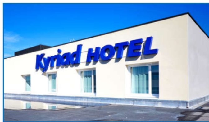
Kyriad Angers Ouest Beaucaouzé 8, Av Aliénor d'Aquitaine 49070 BEAUCOUZE France +33 (0) 2 52 57 00 39