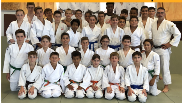
Photo de la Section d'Excellence Sportive

L'objectif de cette section est de permettre à de jeunes judokas de renforcer leur apprentissage technique et sportif au sein d'un groupe ayant les mêmes objectifs. Par le biais de cette Section Sportive, les jeunes judokas peuvent concilier leur réussite scolaire avec une pratique assidue de leur passion : le JUDO.